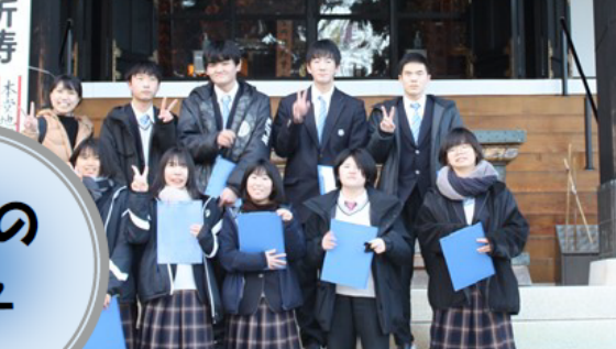
門内フィールドワーク