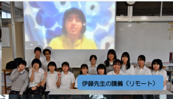
伊藤先生の講義 (リモート)