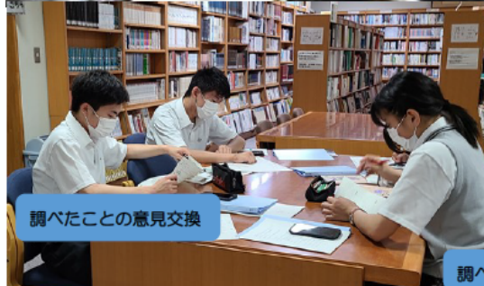
調べたことの見聞交換