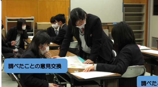
調べたことの見聞交換