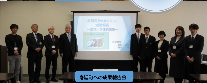
身延町への成果報告会