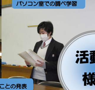
調べたことの発表