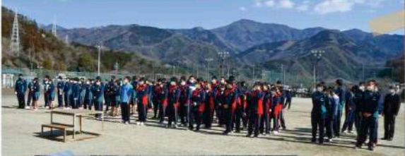
3年ぶりで楽しかったー！