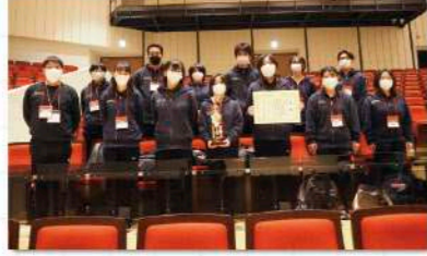
そして、来年度の関東大会は山梨県で行われます。今回の関東大会で学んだことをこれからの作品づくりに活かして、上位大会に出場できるように日々の部活動に取り組んでいきます。