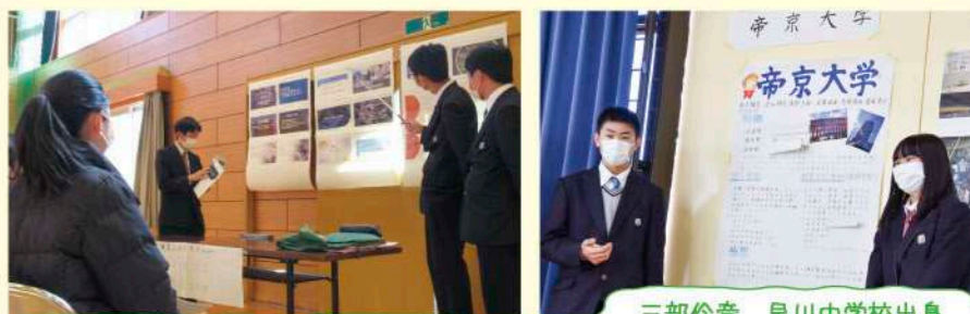
三部伶音 早川中学校出身

今回は、聞き手が少人数の中でいかに充実した発表にすることが出来るかを考えるきっかけとなりました。例えば、クイズを出し難い問題の時は一緒に考え答えを出すこと、相手にとって最も伝わりやすい説明の仕方はいかに、臨機応変に考えることなどです。 このような力は普段の学校生活でも役に立つと思うので、有意義な時間を送ることができたなと感じています。